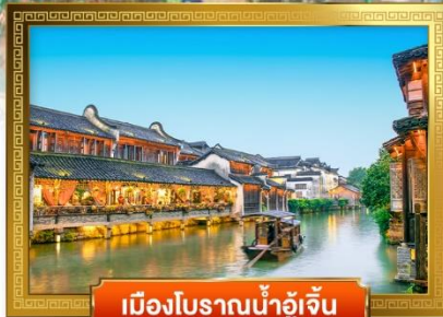
เมืองโบราณน้ำอุ๋จิ้น