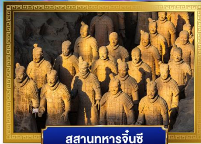
สุสานทหารจีนซี