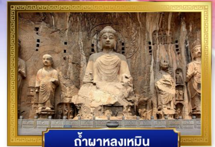
ถ้ำผาลงเหมิน