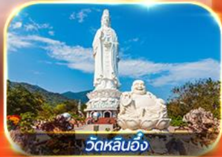
วัดหลินอิ่ง