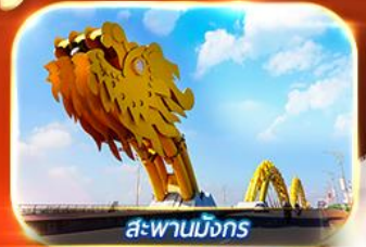
สะพานมังกร

สัมผัสความงามหมู่บ้านฝรั่งเศสที่บานาฮิลล์ เยือนเมืองโบราณฮอยอัน ล่องเรือกระดิ่ง