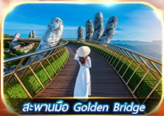
สะพานมือ Golden Bridge