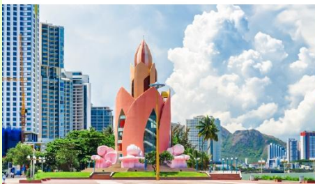
Tram Huong Tower