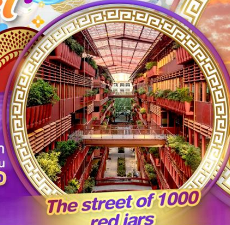
The street of 1000 red jars