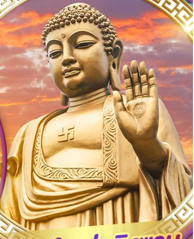
พระใหญ่หลิงซาน

สักการะพระใหญ่หลิงซานต้าฟอ ถ่ายรูปคู่กันดัมยักซ์ ชมสุดยอดพุทธศิลป์ร่วมสมัยของจีน "ศาลาฟานกง"