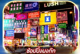
ซ้อปิ้งมงก๊ก

เต็มอิ่ม ทั้งไหว้พระ-ขอพร การเงิน การงานความรักและซ้อปิ้ง ริพัลส์เนย์ จุดชมวิว THE PEAK วัดหมื่นโหมว วัดแชกงหมิว เจ้าแม่กวนอิมสองฮ่า วัดหวังต้าเซียน ซ้อปิ้งมงก๊ก