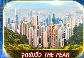
จุดชมวิว THE PEAK