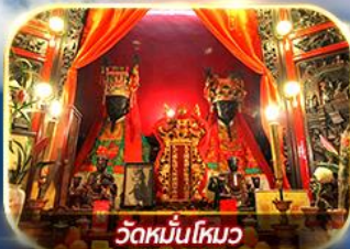
วัดหมื่นโหมว