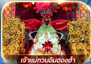
เจ้าแม่กวนอิมสองฮ่า