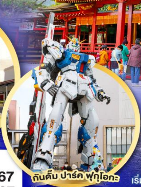
กันดั้ม ปาร์ค ฟุคุโอกะ