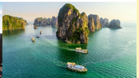
ล่องเรือชมอ่าวฮาลอง

*ทางบริษัทฯ ขอสงวนสิทธิ์ในการสลับโปรแกรมทัวร์ตามความเหมาะสมขึ้นอยู่กับสถานการณ์หน้างาน โดยคำนึงถึงผลประโยชน์ของลูกค้าเป็นสำคัญ