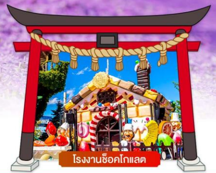
โรงงานช็อคโกแลต