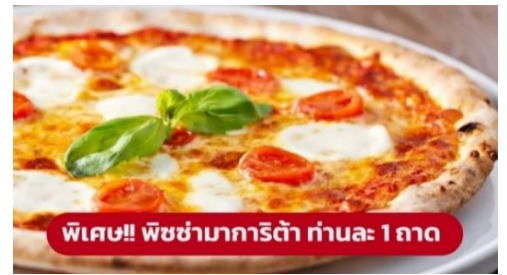
พิเศษ!! พิซซ่ามาการิตต้า ท่านละ 1 ถาด

เป็นมหาวิหารที่ใหญ่เป็นอันดับสองของโลกและรูปแบบการสร้างสถาปัตยกรรมแบบกอธิคที่ใหญ่ที่สุดในโลก มียอดแหลมบนหลังคา มากถึง 135 ยอด จนได้รับฉายาว่า "วิหารเม่น" บนยอดที่สูงที่สุดมีรูปปั้นทองขนาด 4 เมตร ของพระแม่มาดอนน่า