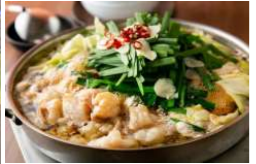
ร้านอาหารย่านยะไต (YATAI)

เย็น อิสระรับประทานอาหารค่ำตามอัธยาศัย เพื่อให้ท่านได้ช้อปปิ้งอย่างเต็มที่ (มีไกด์แนะนำ) พักค้างคืน ณ โรงแรม NISHITETSU GRAND HOTEL (★★★★) หรือเทียบเท่า