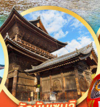
วัดนินเซนจิ