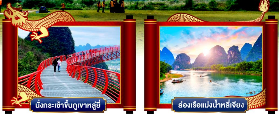
นั่งกระเช้าขึ้นภูเขาหลูอี้