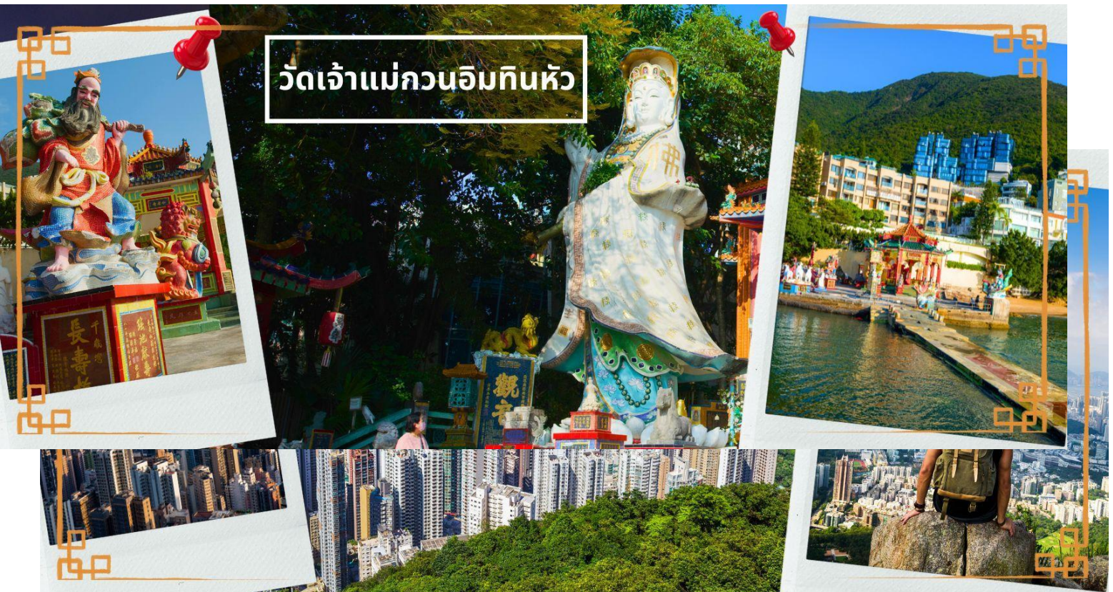
วัดเจ้าแม่กวนอิมทิ่นหัว

ไหว้อธิษฐานขอลูก, สะพานต่ออายุ (สะพานอายุยืน) สะพานสีแดงตั้งอยู่บนริมหาด สีแดงสด