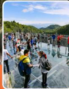
ระเบียงแก้วอุ๋หลง

หว่าอูซานภูเขาโต๊ะใหญ่ที่สุดในโลก 6วัน 5คืน