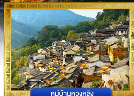
หมู่บ้านหวงหลิง