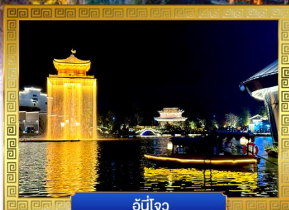
อู๋หนี่โจว