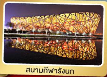
สนามกีฬาฟาริงก