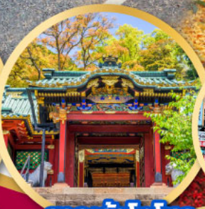
ศาลเจ้าโทโฮคุ