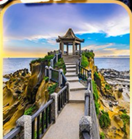
อุทยานเกาเหอผิง