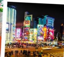
ตลาดซีเหมินติง