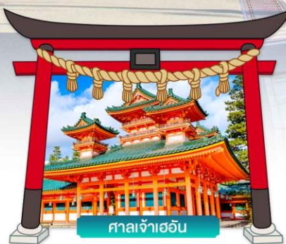
ศาลเจ้าเออัน