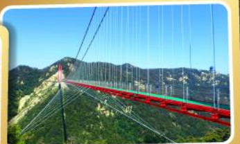
สะพานแขวนอ้ายจ้าย