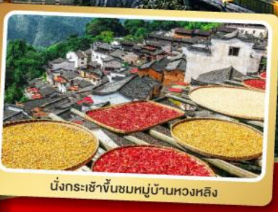
นั่งกระเช้าขึ้นชมหมู่บ้านหวงหลิง