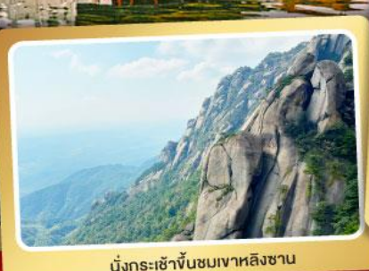
นั่งกระเช้าขึ้นชมเขาหลงซาน