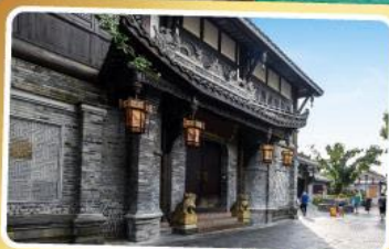
ถนนควานโจ๋เซียงจื่อ