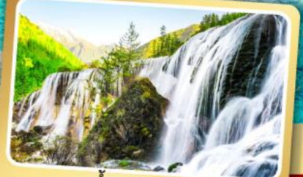
น้ำตกธารไต้บุ๋ก

ชมโชว์เปลี่ยนหน้ากาก เมนูพิเศษ สุกี้หม่าล่าสดจน