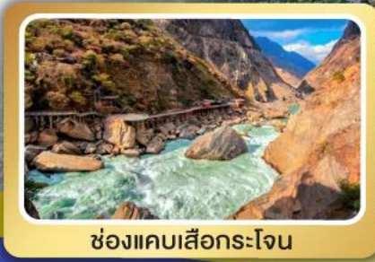
ช่องแคบเสือกะโจน