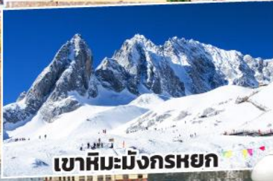
เขาคิมะมิงกรหยก