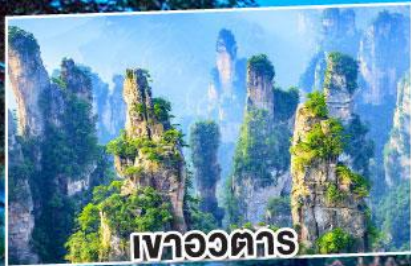
เหวอจวตาร