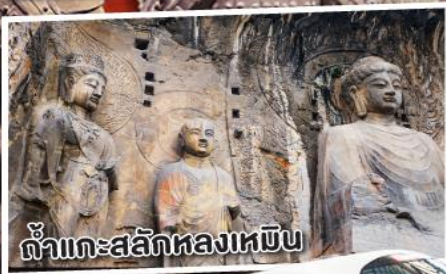
ถ้ำแกะสลักหลงเหมิน