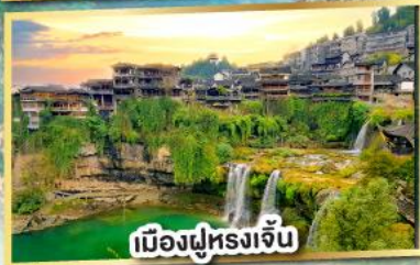
เมืองฝูหรงเจิน