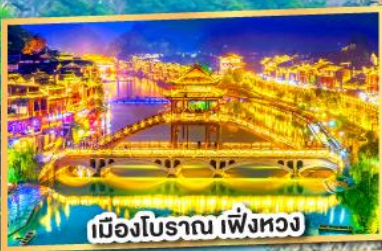
เมืองโบราณ เฟิ่งหวง