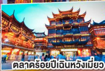
ตลาดร้อยปีเงินหวังเมี่ยว