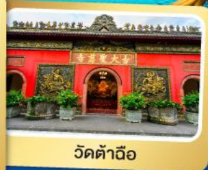
วัดต้าเจี๊ว