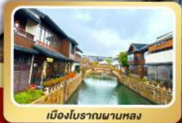
เมืองโบราณผานหลง