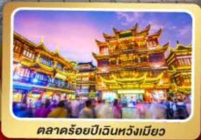
ตลาดร้อยปีเวินหวงเมี่ยว