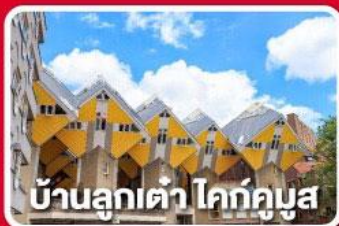
บ้านลูกเต่า โคกคูมูส