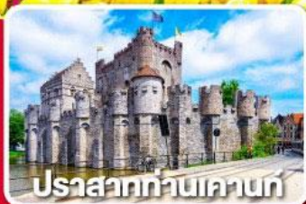
ปราสาทท่านเคานท์