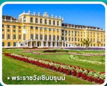
• พระราชวังเซ็นบรูน์