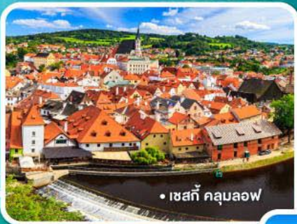
• เซสกี คลุมลอฟ