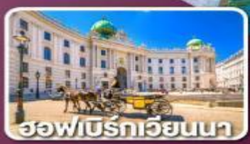
ฮอฟเบิร์กเวียนนา

ตามรอยซีรีส์ Crash Landing on you ที่ทะเลสาบเบรียนซ์