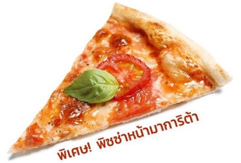
พิเศษ! พิซซ่าหน้ามาการิตต้า

เที่ยง ๑๐ รับประทานอาหารเที่ยง (มื้อที่1) จากนั้นนำท่านเดินทางสู่ เมืองปิซ่า (Pisa) (ระยะทาง 355 ก.ม. / 6 ชม.) เป็นเมืองที่เป็นที่รู้จักอย่างดีเกี่ยวกับ หอเอนเมืองปิซาซากโบราณวัตถุของเมืองที่ยังหลงเหลือจากศตวรรษที่5ก่อนคริสตกาล เป็นเมืองที่เคยมีความสำคัญมากด้านการค้าขายในแถบทะเลเมดิเตอร์เรเนียน