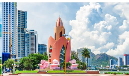
Tram Huong Tower