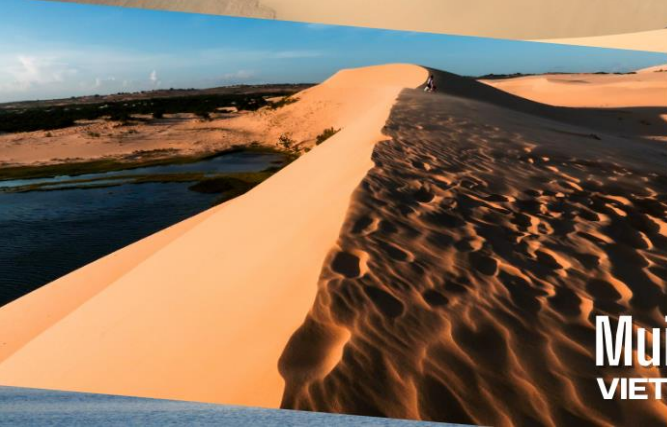
Mũi Ne VIETNAM