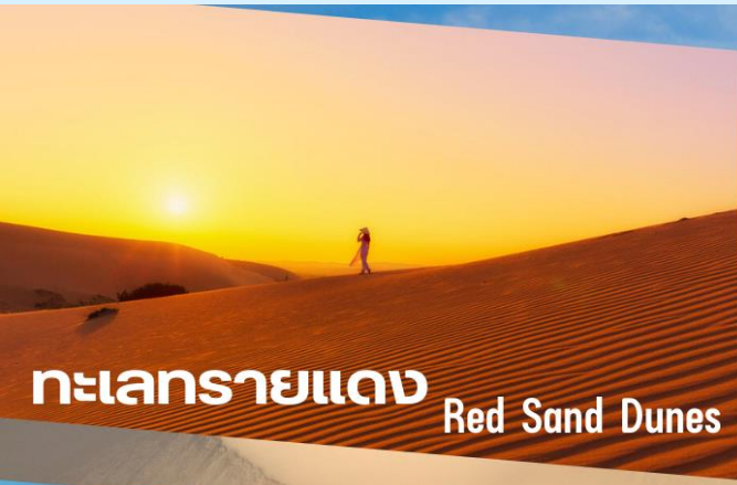
ทะเลทรายแดง Red Sand Dunes