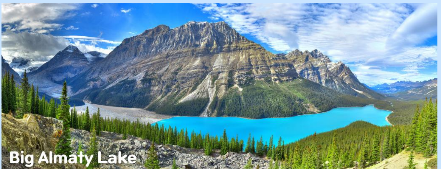
Big Almaty Lake

เช้า รับประทานอาหารเช้า ณ ห้องอาหารโรงแรม