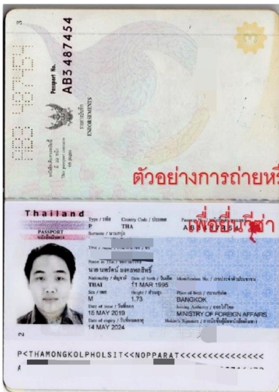
ตัวอย่างการถ่ายหรือสแกนหน้าพาสและรูป

หมายเหตุ : กรณีที่ให้เอกสารมาใช้เงิน ภาพถ่ายเป็นภาพที่อายุเกิน 6 เดือนแล้ว หากต้องสแกนส่งสถานทูตใหม่ อาจจะโดนค่ายื่นใหม่อีกครั้งจากสถานทูตนะคะ ประมาณ 3,500 บาท