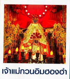
เจ้าแม่กวนอิมสองฮ่า