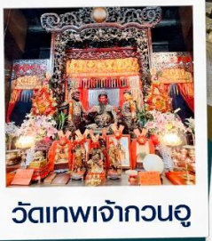
วัดเทพเจ้ากวนอู