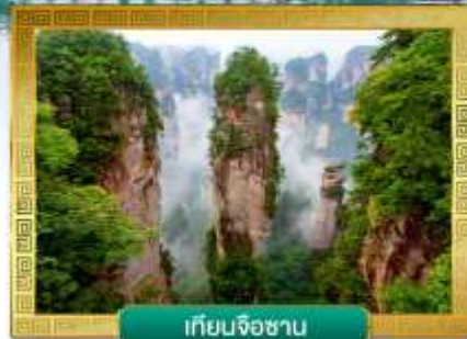
เทียนจื่อซาน

✔ ชมจุดเช็คอินใหม่!! ตึกมหัศจรรย์ 72 ชั้น