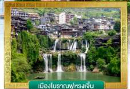
เมืองโบราณฟุหรงจั้น