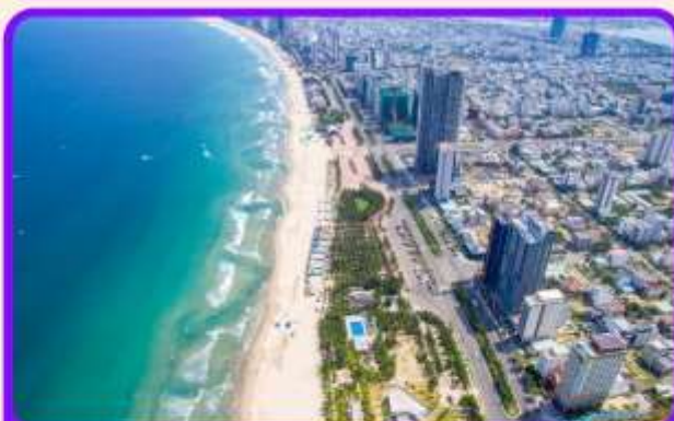
เช็คอิน ชายหาดหมีเคว เป็นชายหาดที่สวยงามที่สุดในเมืองดานัง