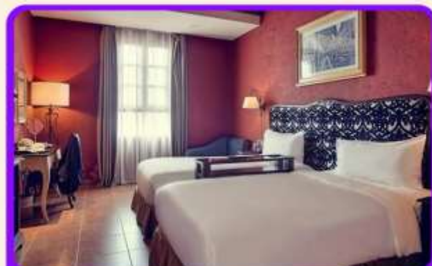
พักบานาฮิลล์ 1 คืน