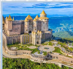
ปราสาทจันทร