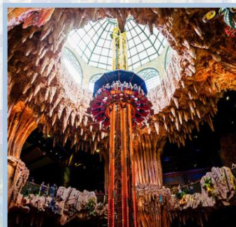
สวนสนุก Fantasy Park