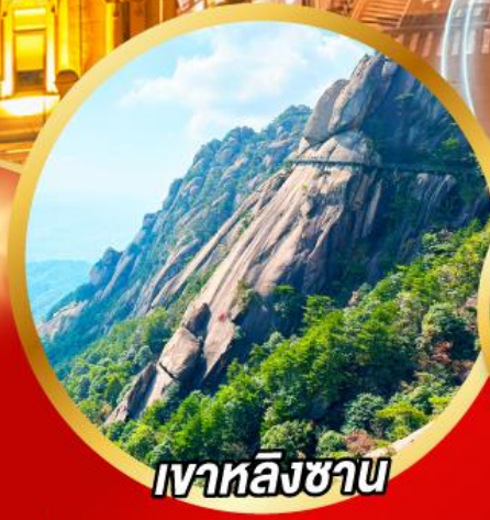
เวาหลิงซาน