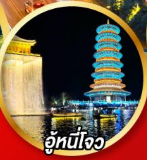
อู่หนี่โจว