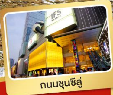
ถนนชุนชู่