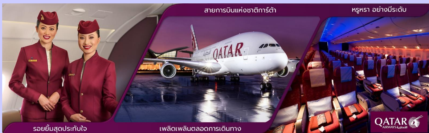
รอยยิ้มสุดประทับใจ

17.30 น. คณะเดินทางพร้อมกัน ณ ท่าอากาศยานสุวรรณภูมิ อาคารผู้โดยสารขาออก ประตูที่ 8 เคาน์เตอร์ P โดยสายการบินกาตาร์แอร์เวย์ (QATAR AIRWAYS) โดยมีเจ้าหน้าที่ของบริษัทฯ คอยให้การต้อนรับและอำนวยความสะดวกเรื่องเอกสารและสัมภาระ