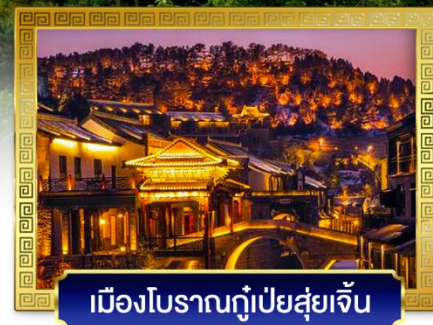
เมืองโบราณกุ่เป่ย์สู่ยเจิ้น