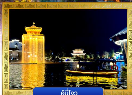
อู๋หนี่โจว