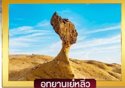
อุทยานเย่หลิว